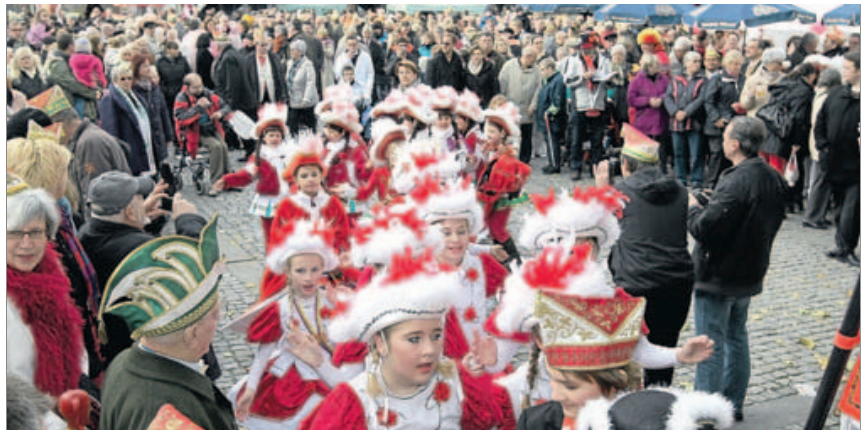
Großer Andrang herrschte beim Biwak auf dem Kohlmarkt.